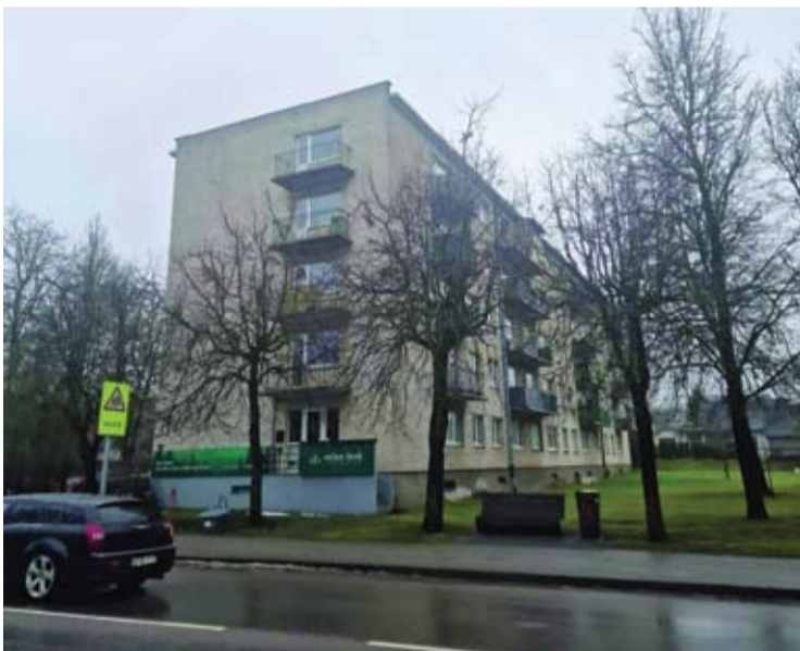
Daugiabučių namų gyventojai dažnai kenčia nuo triukšmaujančių kaimynų.

Robertas ALEKSIEJŪNAS robertas.a@anyksta.lt