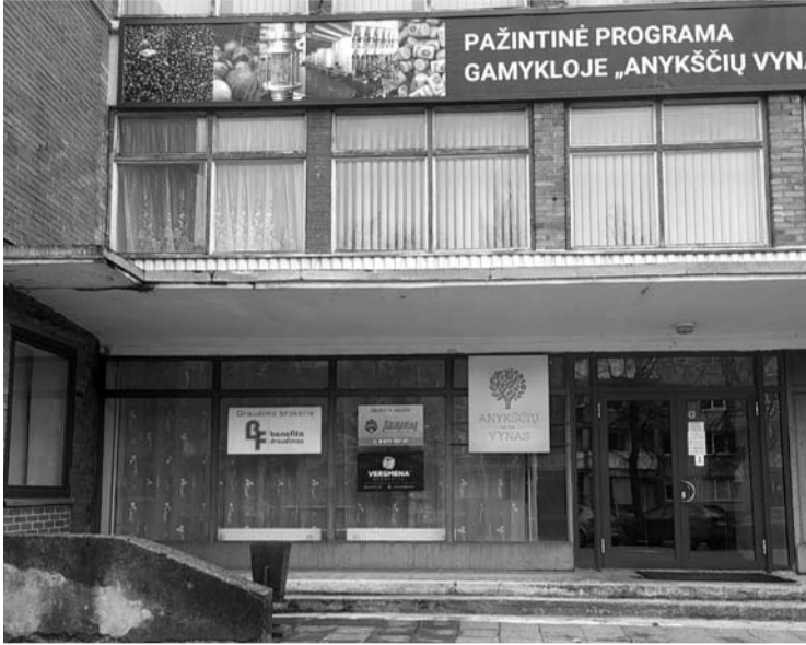
Ant „Anykščių vyno“ gamyklos sienos nebeliko „Nykščių“ iškabos. Skirtinguose šaltiniuose nurodomi skirtingi UAB „Atvirai“ adresai.