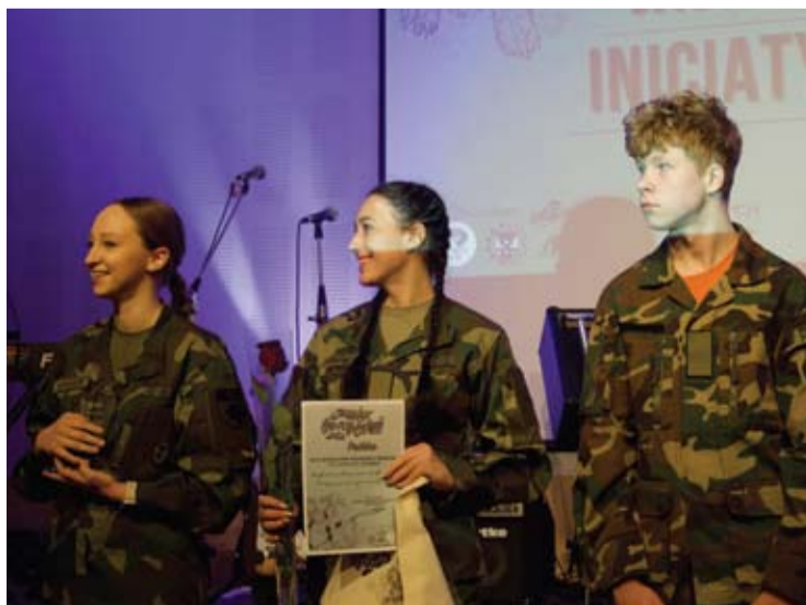
„Metų jaunimo grupė“ paskelbta Anykščių Dariaus ir Girėno 901-oji šaulių kuopa.