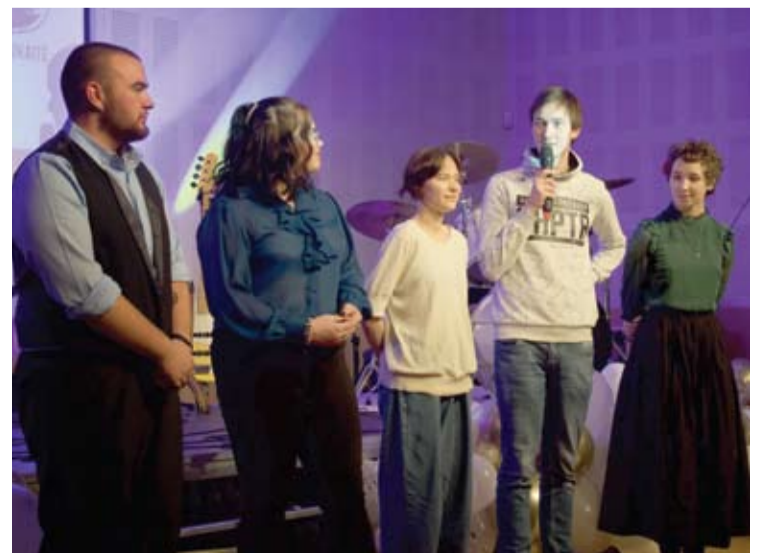
„Metų kūrybiškos sielos“ – grupė „Trys centai“.